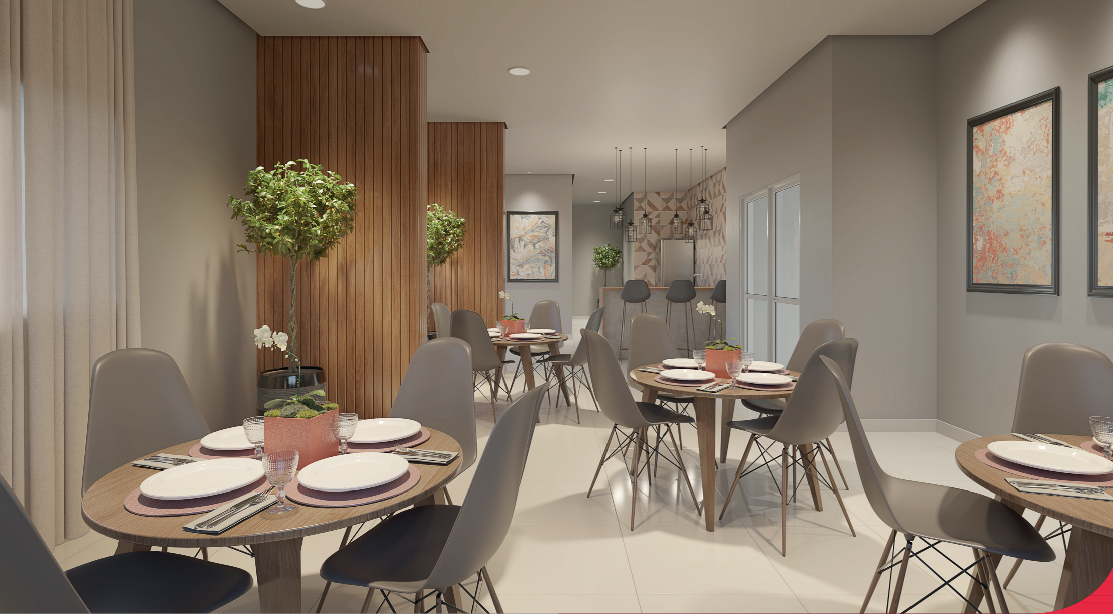
Perspectiva artística - Salão de festas