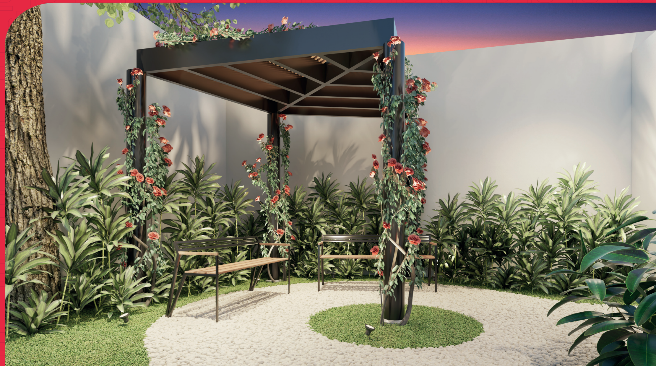
Perspectiva artística - Praça com Pergolado