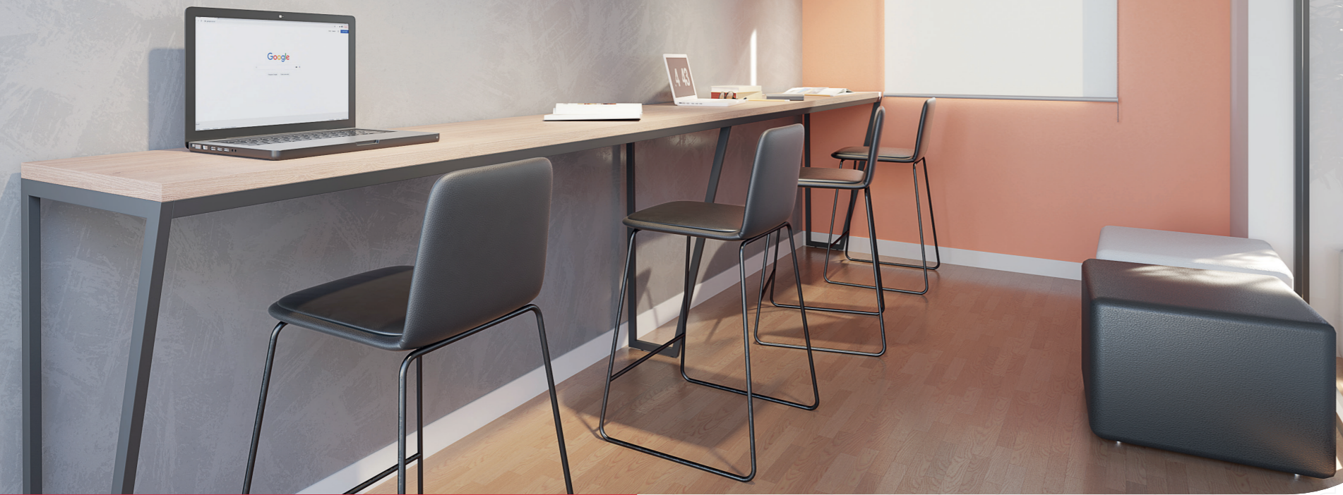
Perspectiva artística - Coworking