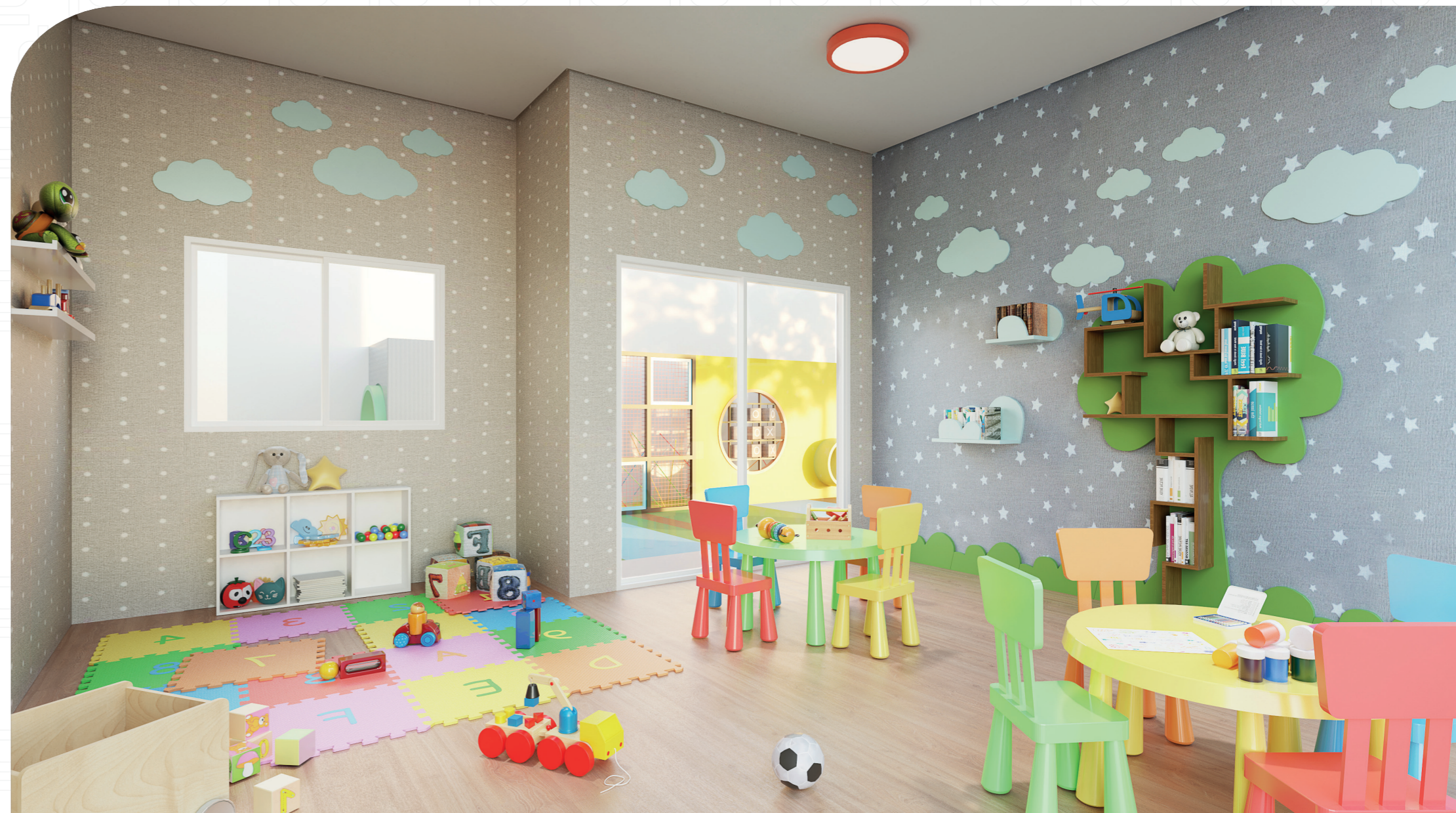
Perspectiva artística - Brinquedoteca