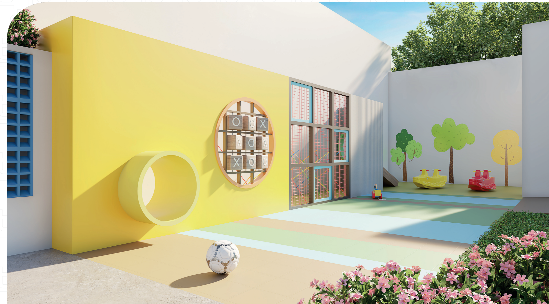
Perspectiva artística - Playground Infantil