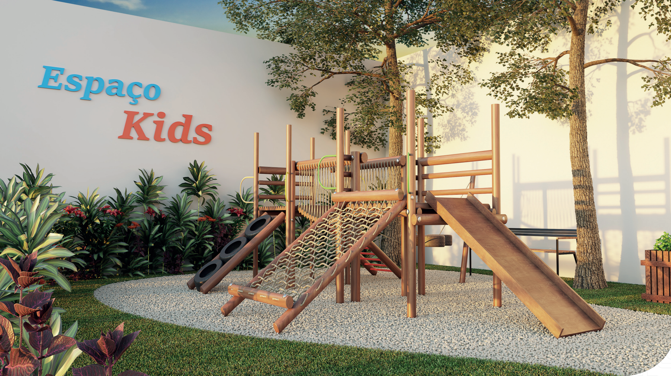
Perspectiva artística - Playground Infantojuvenil