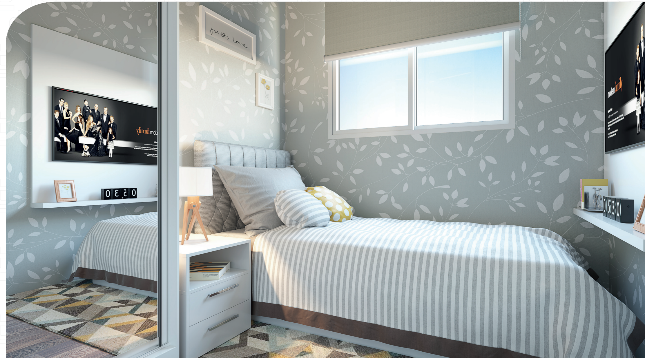
Perspectiva artística - Quarto solteiro