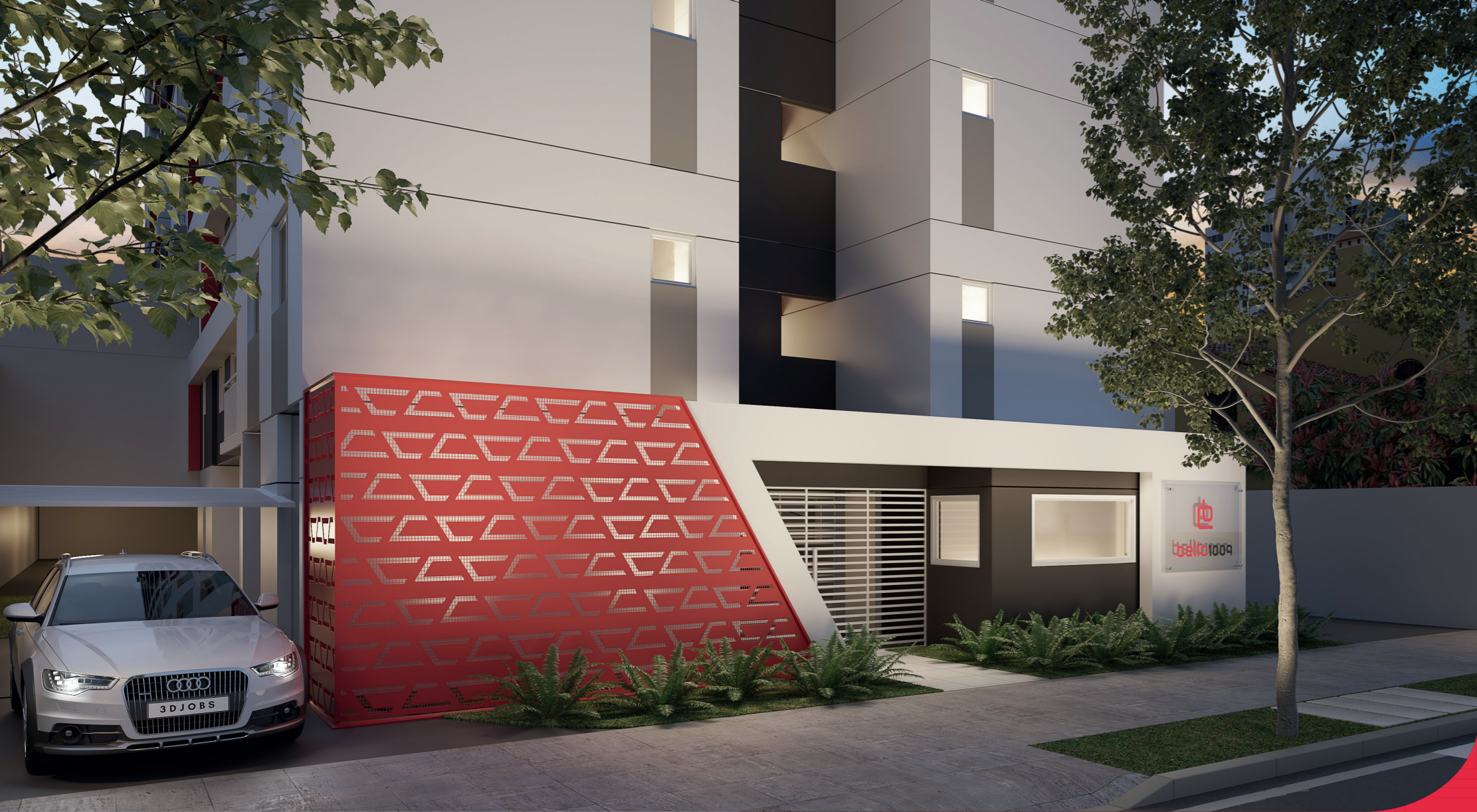
Perspectiva artística - Guarita