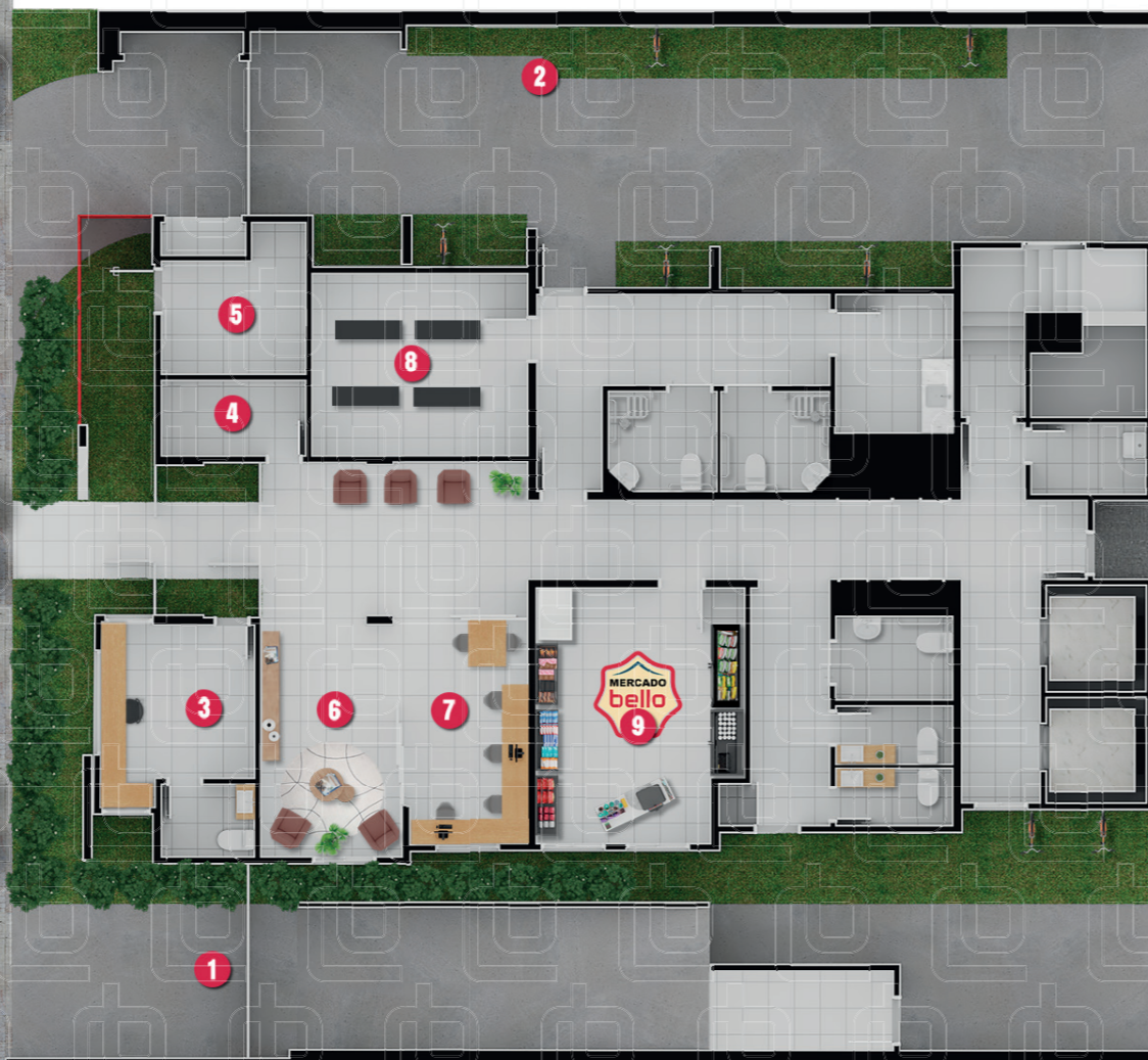
Perspectiva artística - Implantação