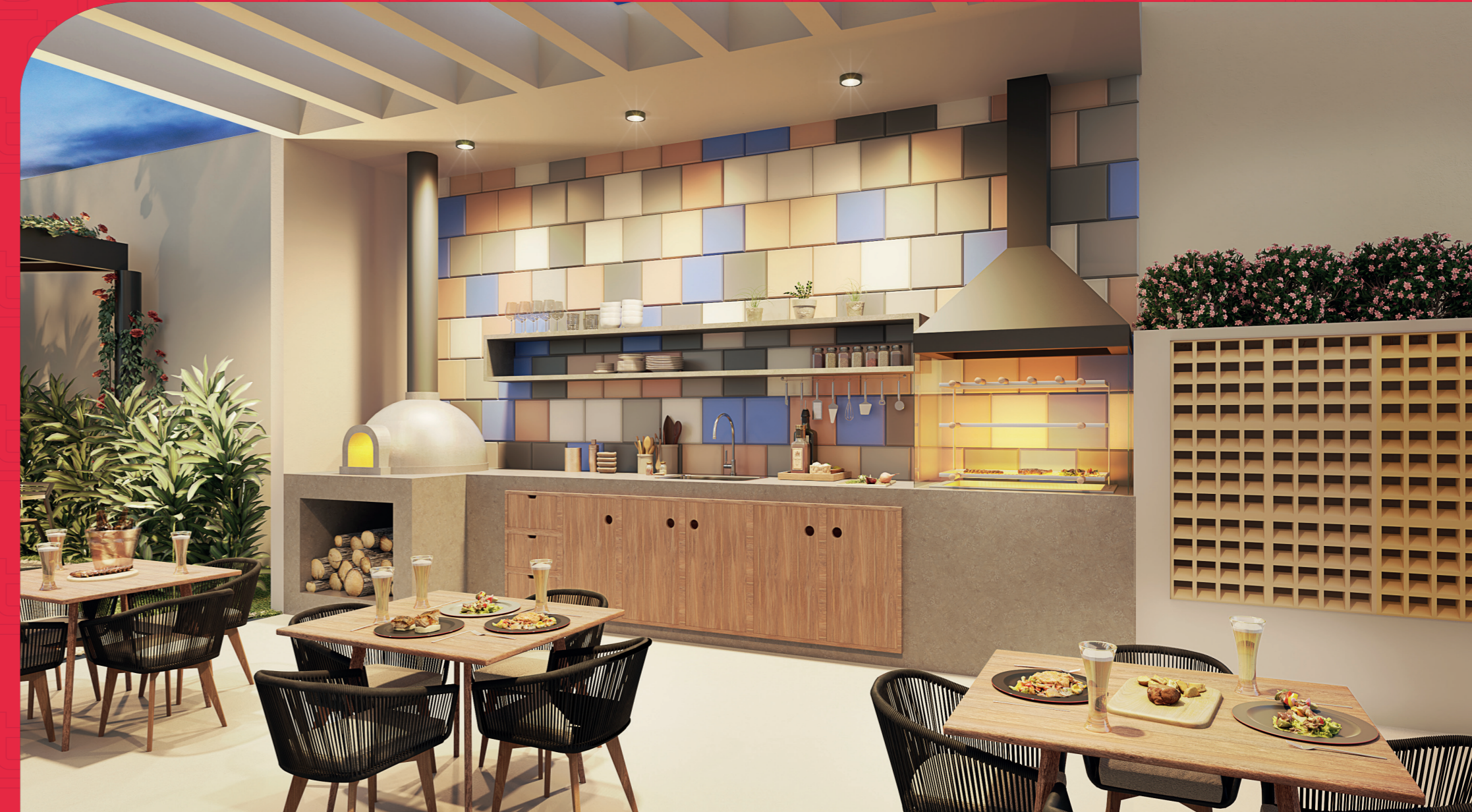
Perspectiva artística - Churrasqueira