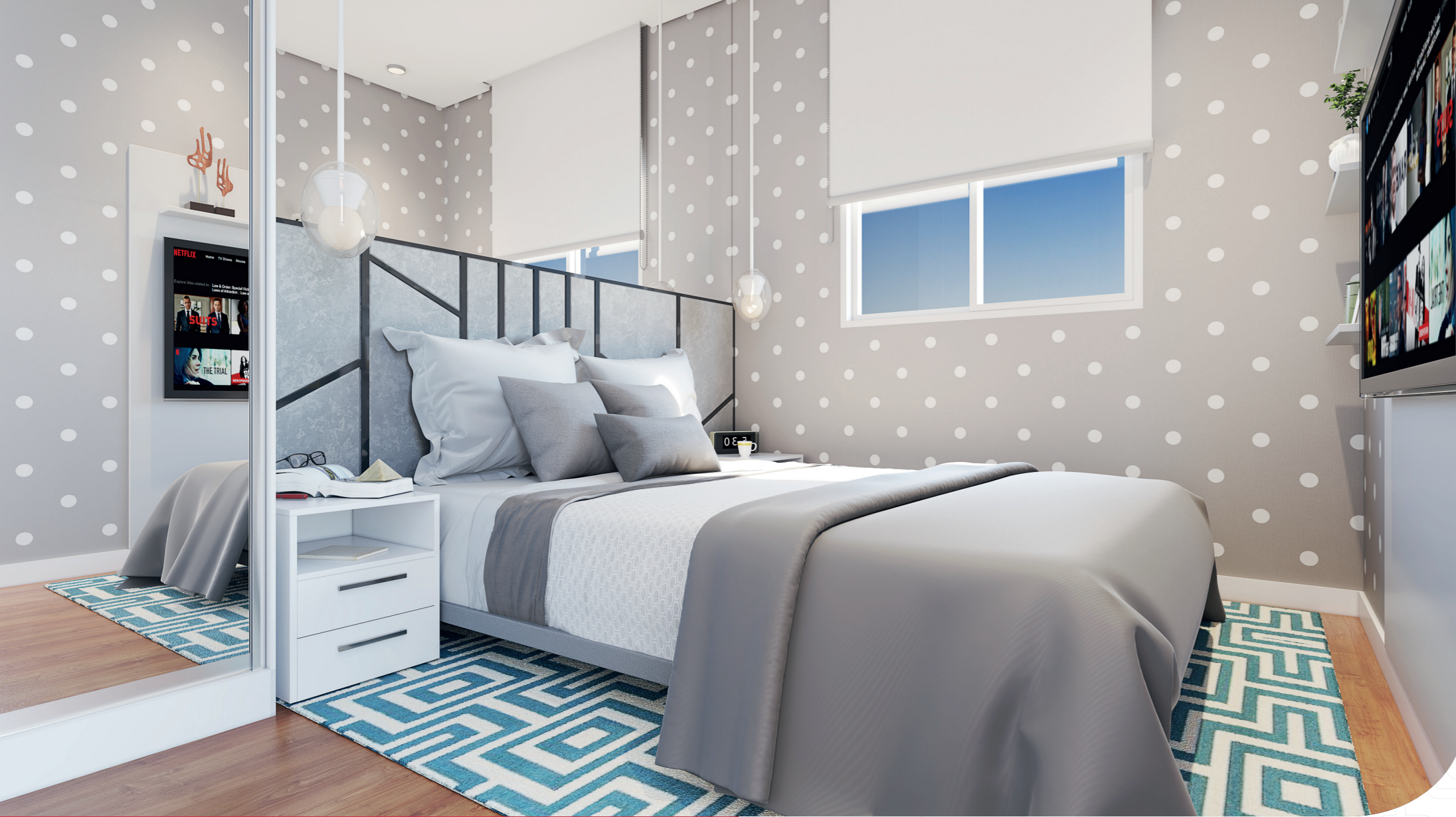
Perspectiva artística - Quarto casal